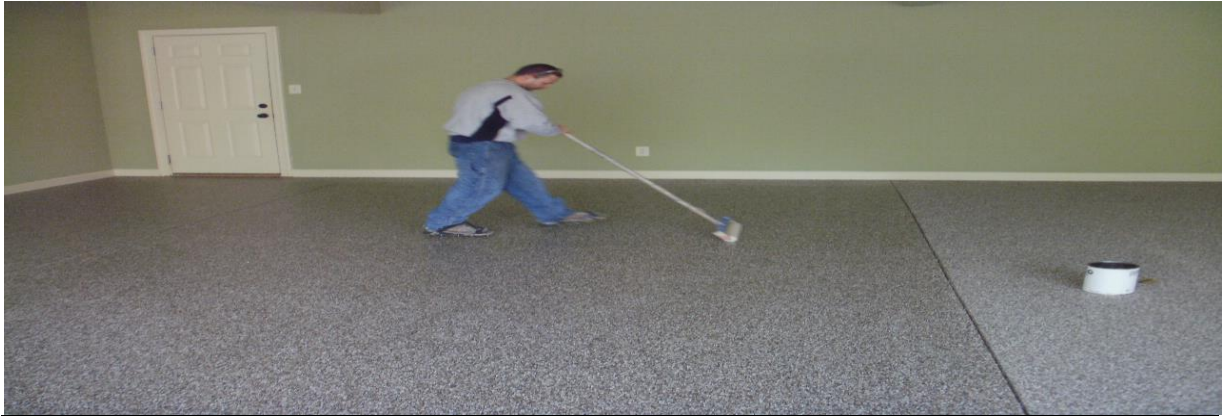
EPDM&SBR RUBBER FLOORING

Toplam Kalınlık :1-2-3-4-5-6-7-8-9-10 mm Üst Tabaka Kalınlığı :1-10 mm TEK TABAN Ağırlık :HER mm 500 g/m 2