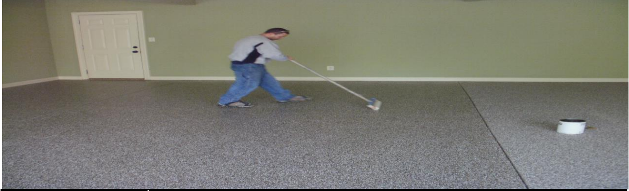
EPDM&SBR RUBBER FLOORİNG